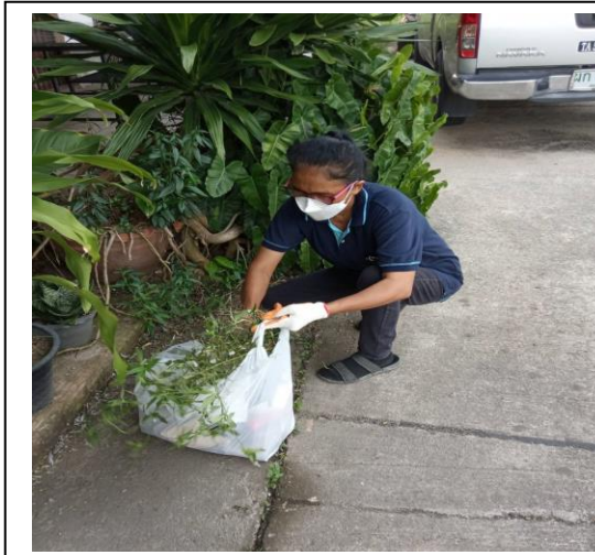
ภาพกิจกรรมรณรงค์ Big cleaning แต่ละครอบครัว 10 หมู่บ้าน (เม.ย.64)

๕) ภาพกิจกรรม ที่ระบุวัน เวลา สถานที่จัดกิจกรรมที่ชัดเจน